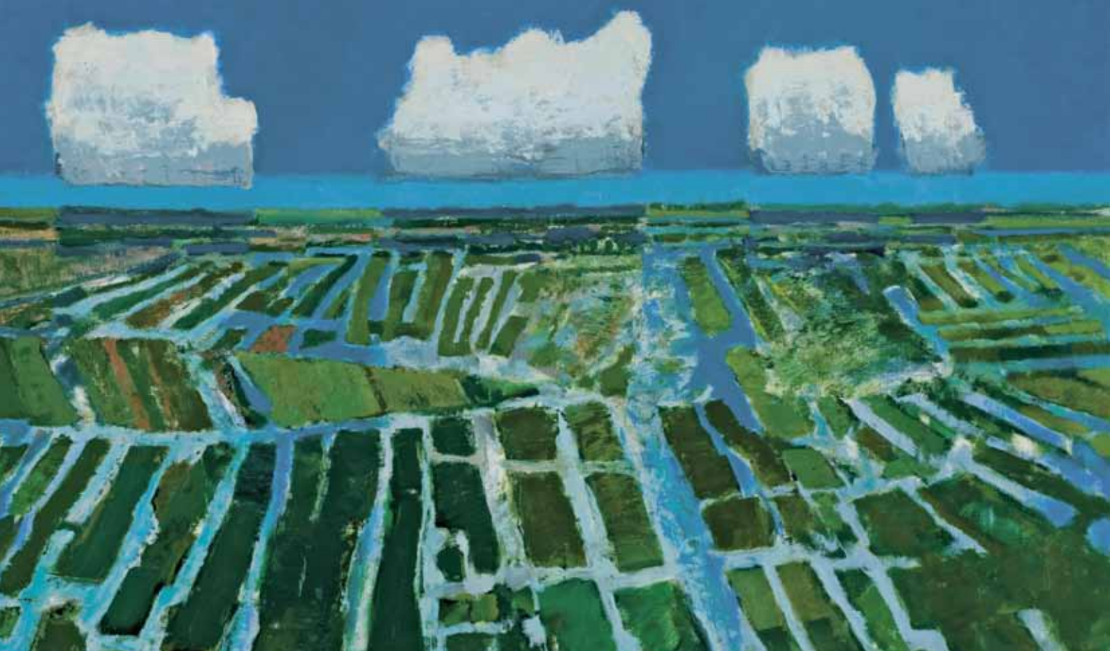
Jaap Ploos van Amstel, 'Noordhollands Slagenlandschap', olieverf op doek, 2006